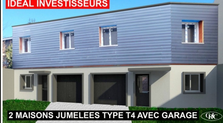
2 MAISONS JUMEELES TYPE T4 AVEC GARAGE